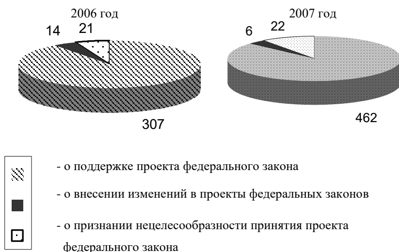
Рис. 1 Структура решений краевого Совета по проектам федеральных законов

Так, прокуратурой Алтайского края в 2007 году направлено в краевой Совет 23 заключения на проекты правовых актов, 6 из них отклонены как спорные с правовой точки зрения или носящие рекомендательный характер.